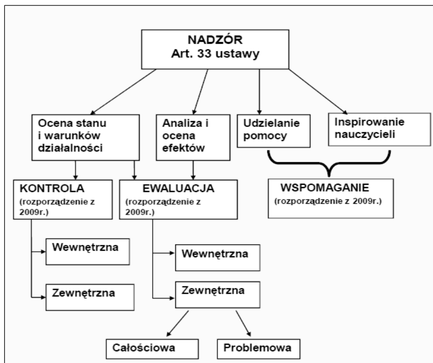
Rysunek 1. Zmiany w nadzorze pedagogicznym – porównanie rozporządzeń z 2006 r. i 2009 r.