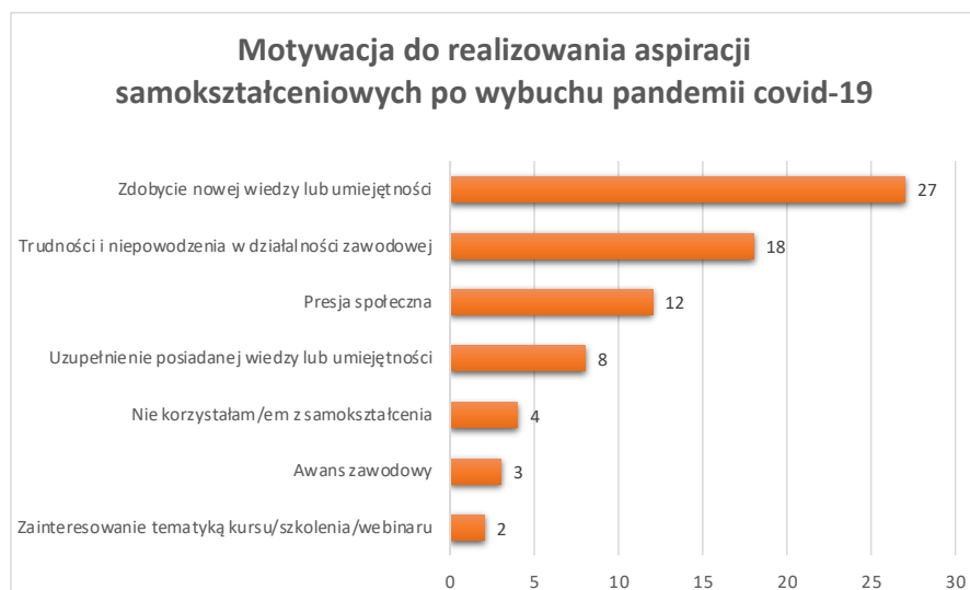
WYKRES 2. Motywacja do realizowania aspiracji samokształceniowych po wybuchu pandemii Covid-19

już tylko dwie. Oznaczać to może podejmowanie edukacji w zakresie umiejętności koniecznych, choć nie uznawanych za wysoce interesujące. Duża zmiana zaszła również w kwestii awansu zawodowego jako motywatora do podejmowania kształcenia przez nauczycieli. Z piętnastu respondentów, którzy wybrali taką odpowiedź w pierwszym badaniu, w drugim zostało już tylko trzech. Nie koniecznie oznacza to jednak, że nauczyciele przestali zabiegać o awans zawodowy, być może nie jest on już po prostu główną przyczyną realizowania aspiracji edukacyjnych. Powyższe dane przedstawiono na wykresie nr 2.