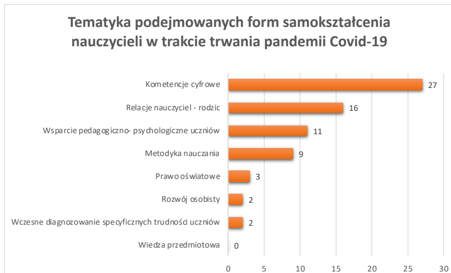
WYKRES 4. Tematyka podejmowanych form samokształcenia nauczycieli w trakcie trwania pandemii Covid-19