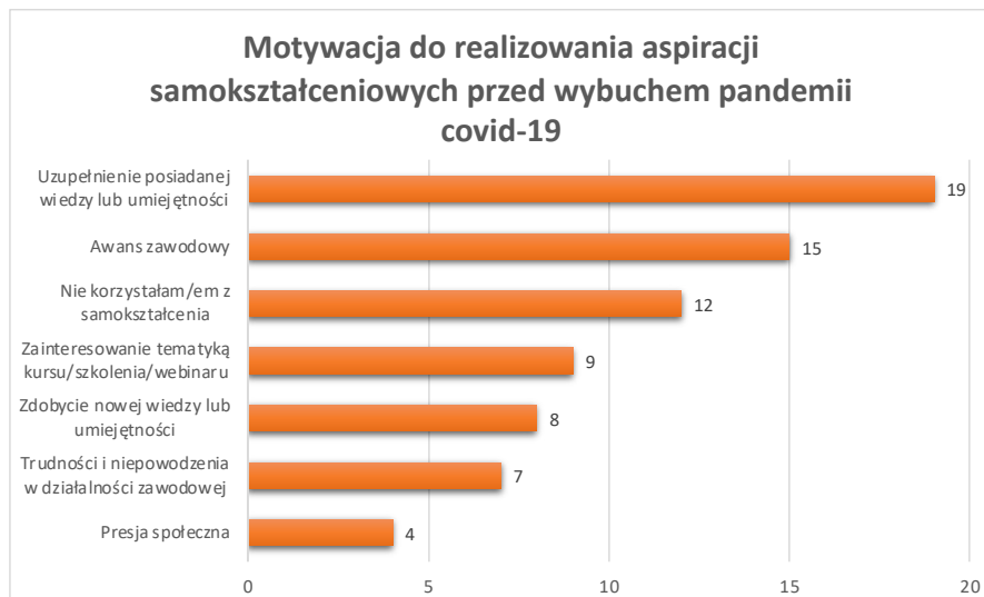
WYKRES 1. Motywacja do realizowania aspiracji samokształceniowych przed wybuchem pandemii Covid-19